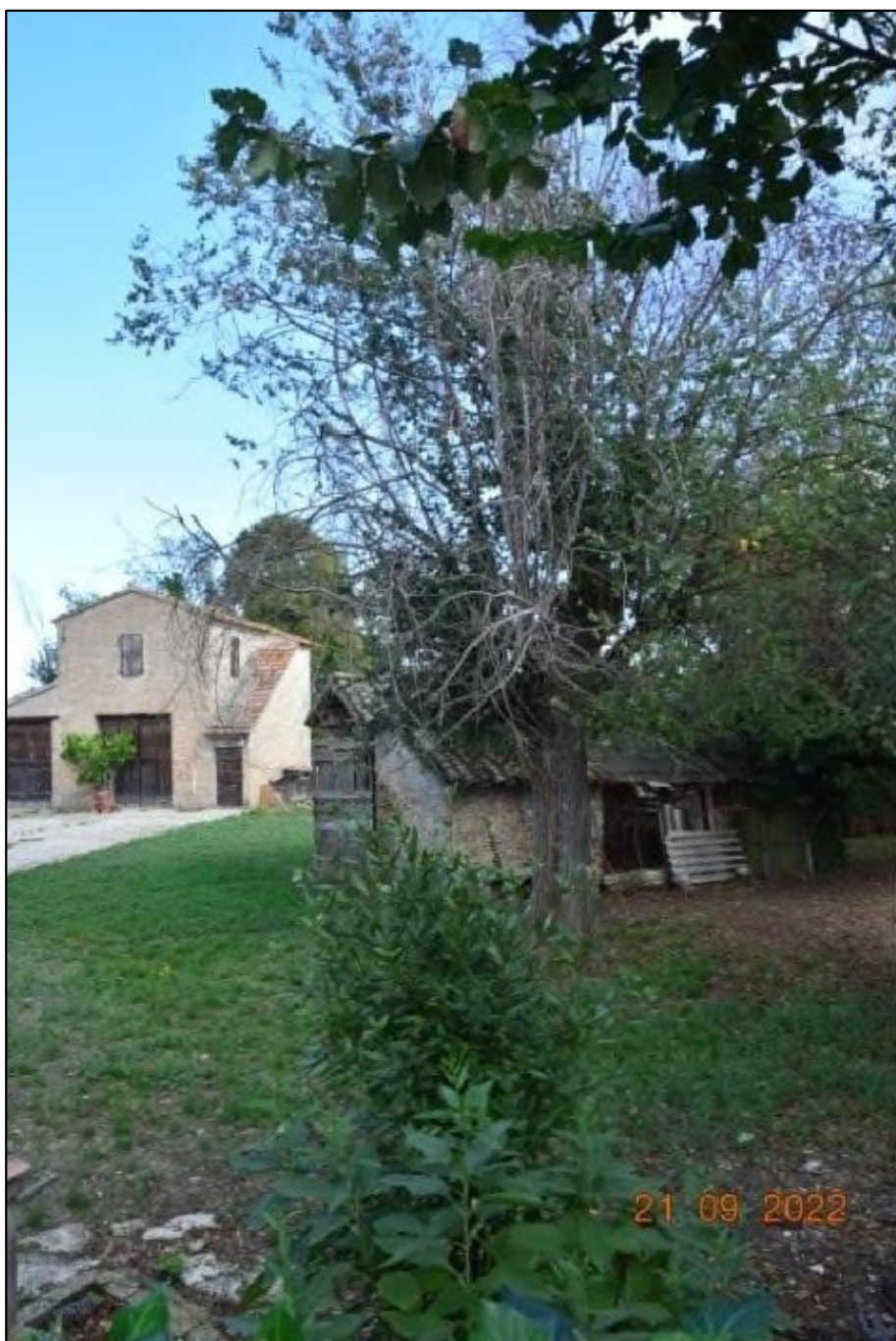
4. Fabbricato rurale con corte, attualmente non in uso ed in stato di abbandono, vegetazione tappezzante ed ombreggiante scarsamente mantenuta.