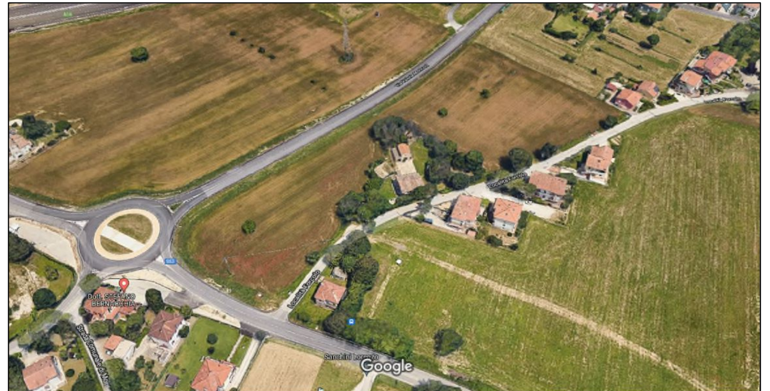
2. Vista dall'alto dell'area di intervento