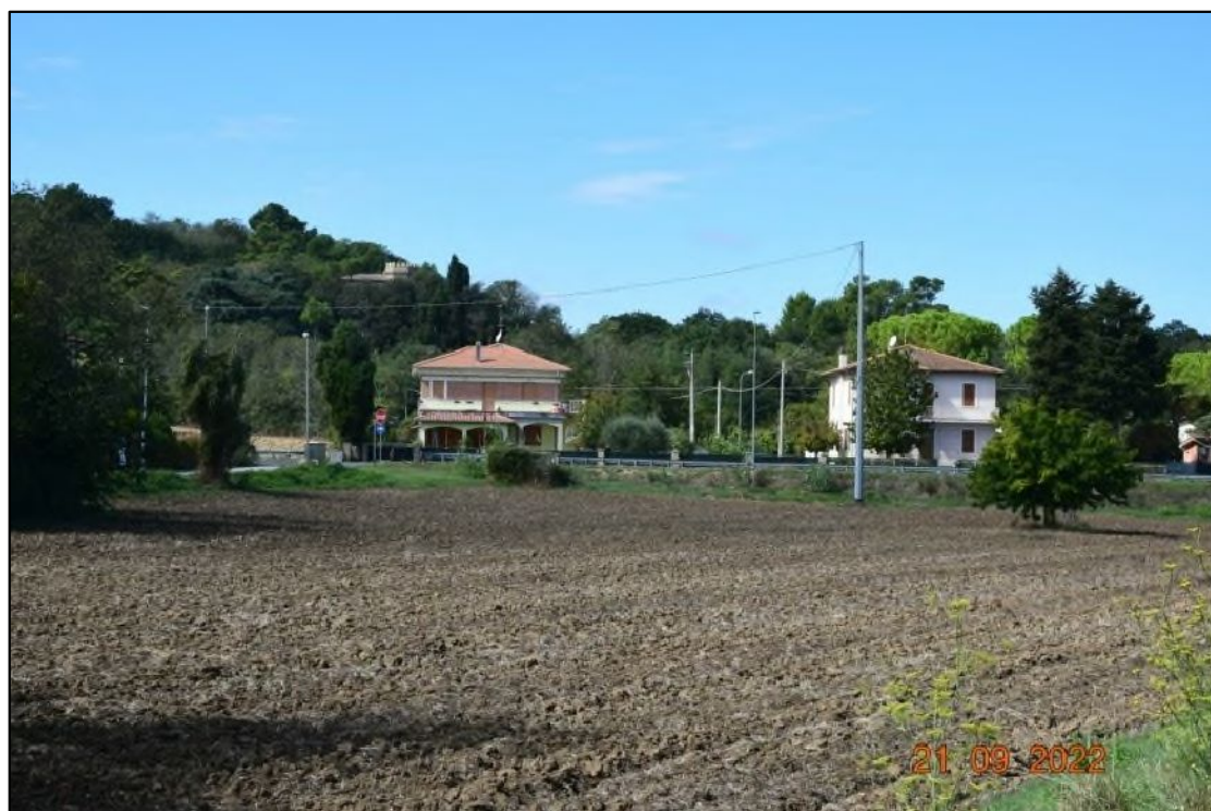
5. Terreno ad uso agricolo, coltivato con seminativi in successione culturale e presenza di gelsi singoli