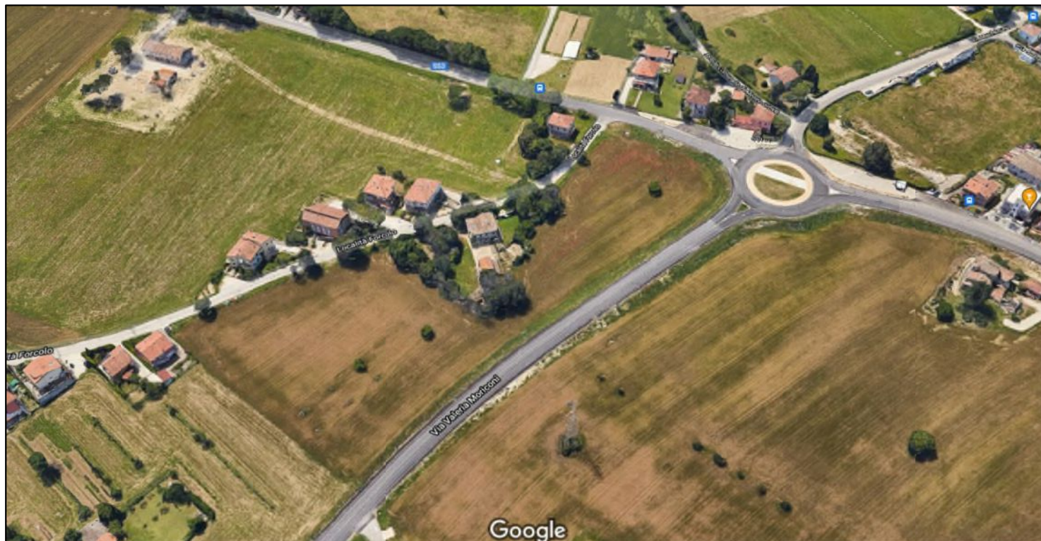
1. Vista dall'alto dell'area di intervento