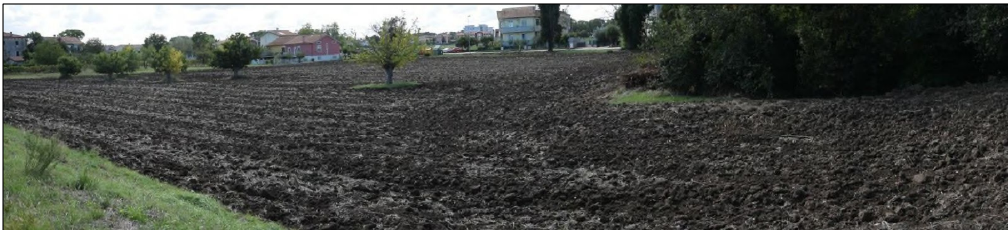
3. Panoramica su stato attuale del terreno in proprietà, sede del nuovo comparto