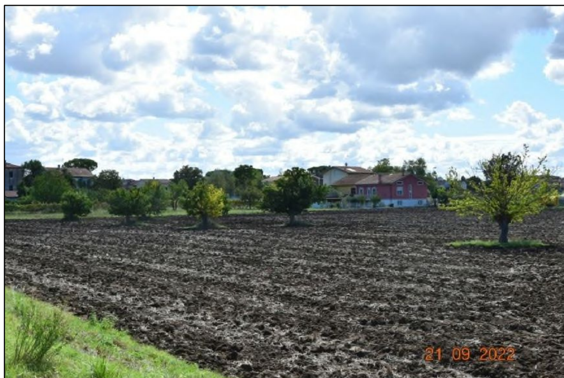
7. Terreno ad uso agricolo, coltivato con seminativi in successione culturale e presenza di gelsi singoli