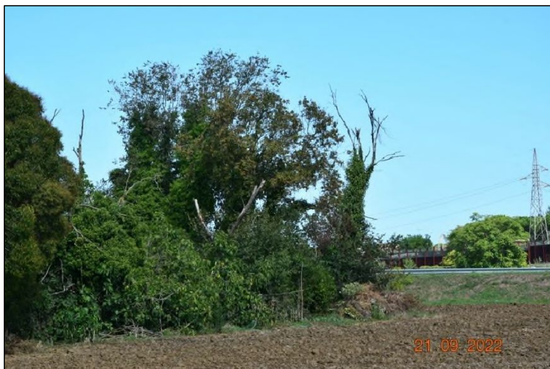
6. Stato di manutenzione delle alberature: presenza di piante secche colonizzate da edere in simbiosi, su lato via Forcolo