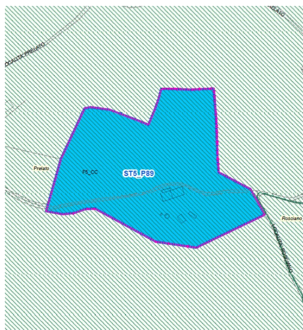
estratto PRG variante

La proposta di variante inserisce una zona F5_CC - Zone per Attrezzature di interesse collettivo – CONVENTO , ed in particolare il COMPARTO ST5_P89 .